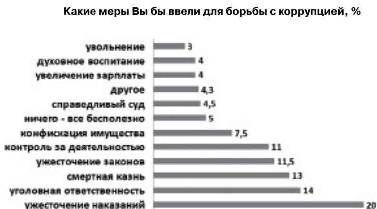
Рис. 1. Меры по борьбе с коррупцией

В рамках выполнения государственного контракта ООО «Ресурс-Консалт» в 2012 году проведены работы по социологическому исследованию «Оценка эффективности государственной политики в сфере безопасности и противодействия коррупции в Красноярском крае» 1 . Исследователи поставили перед собой такие задачи, как выявление и анализ оценки населением уровня состояния коррупции в Красноярском крае в 2012 году; оценка факторов, способствующих распространению коррупции,