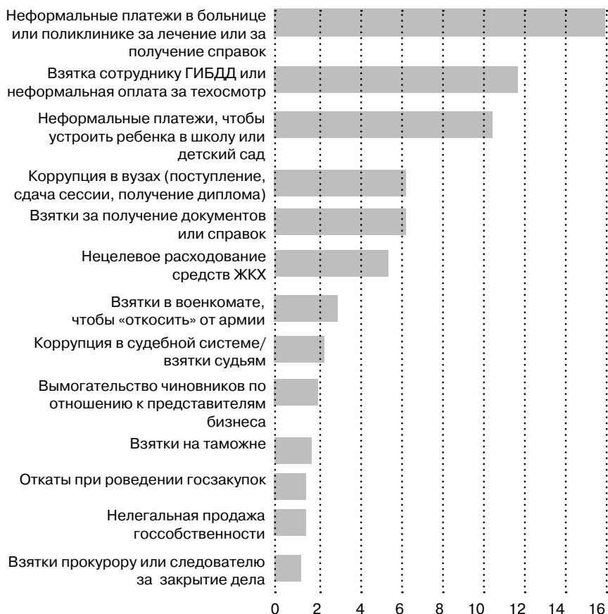
Рейтинг «популярности» неформальных коррупционных сделок в Российской Федерации

И все же наблюдается много проявлений правового нигилизма и отчуждения от права. Забвение публичных ценностей и инте-